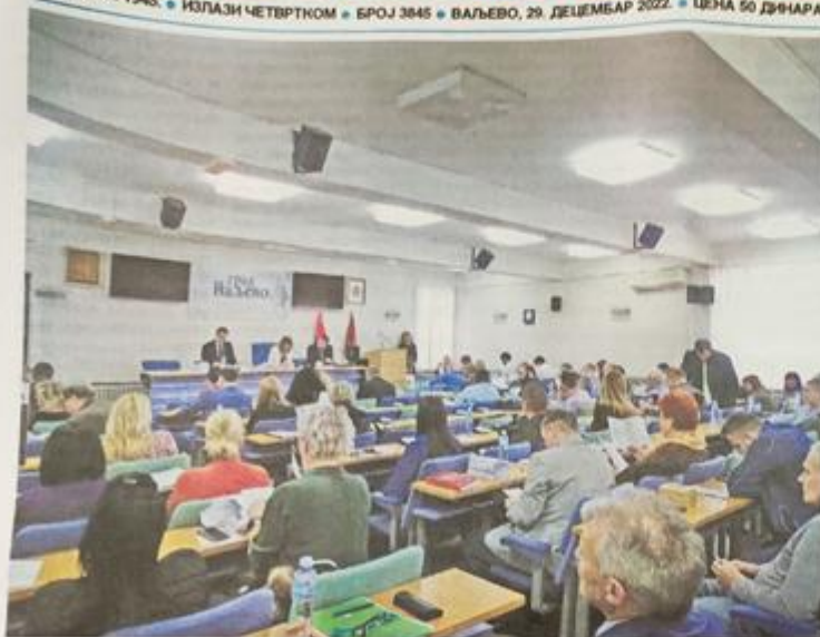
СЕДНИЦА СКУПШТИНЕ ГРАДА ВАЉЕВА СА ОБИМНИМ ДНЕВНИМ РЕДОМ

ОСНОВАН 1945. • ИЗЛАЗИ ЧЕТВРТОМ • БРОЈ 3845 • ВАЉЕВО, 29. ДЕЦЕМБАР 2022. • ЦЕНА 50 ДИНАРА